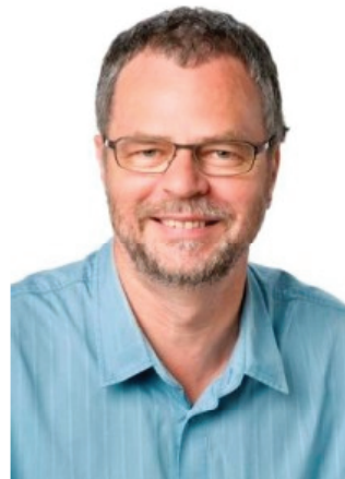
André Rotzetter © Travail.Suisse Aargau